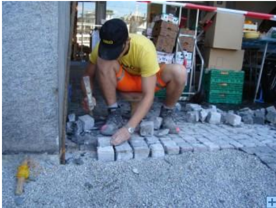
Stein für Stein Handwerk

Eine Schnur hilft dem Pflasterer, die Steine in eine gerade Linie zu bringen. Mit einem Hammer schlägt er sie in die richtige Position. Mit einem zweiten Hammer werden sie dann in die gewünschte Grösse und Form gebracht. Die Arbeit verlangt viel Präzision. Nicht von ungefähr heisst es, Pflasterer hätten intelligente Hände.